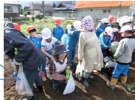
販売前から大行列です。うれしさと忙しさでてんてこまいの5年生でした。

サツマイモ掘り終了後、子どもたちがおじいさんやおばあさんの肩たたきをしました。小さな手ですが、心を込めて優しくたたきました。