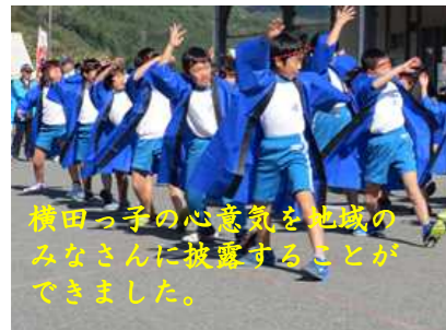
横田っ子の心意気を地域の人みなさんに披露することができました。

よさこいソーランは、運動会でも発表しましたが、今回は、そのときを上回る切れのある踊りを見せてくれました。また、5年生は、学校田で育てた「勇気米」を販売し、なんと10分かからず売り切れという大盛況ぶりでした。ご協力いただいた皆さん、ありがとうございました。